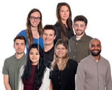
und das Team Kursbetreuung